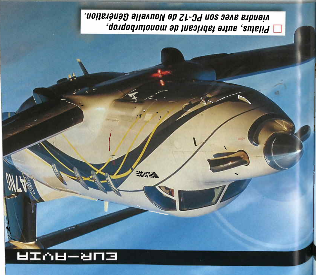
□ Pilatus, autre fabricant de monoturbo-prop, viendra avec son PC-12 de Nouvelle Génération.

Aérostock revient en 2010 à Eur-Avia en force avec les groupes de démarrage Hobart, les gé-